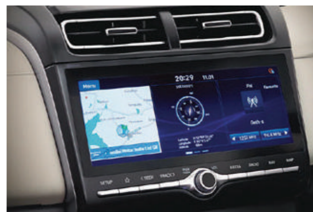
Màn hình giải trí 10.25 inch

CRETA mang đến sự thoải mái tối đa bằng không gian rộng rãi cùng các tiện ích hàng đầu phân khúc