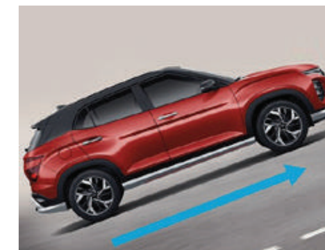
Khởi hành ngang dốc HAC (Tất cả các phiên bản)