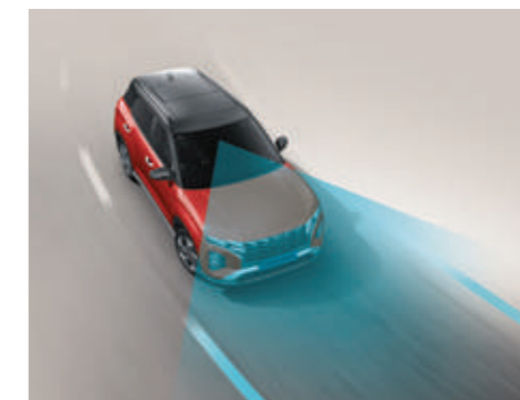
Hỗ trợ giữ làn đường LFA (Bản Cao Cấp)