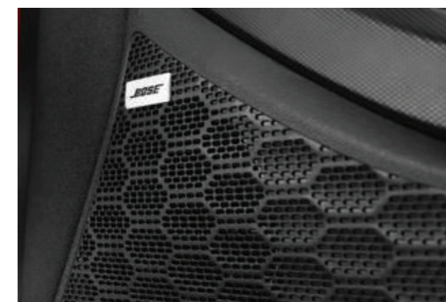
Hệ thống loa Bose cao cấp (Bản Đặc Biệt và Cao cấp)