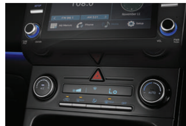
Điều hòa tự động (Bản Đặc Biệt và Cao cấp)