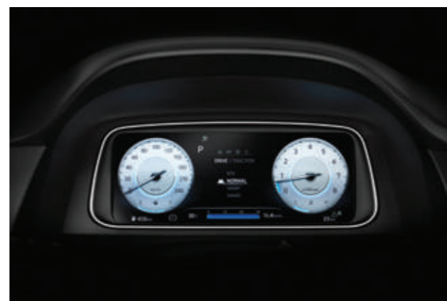
Màn hình thông tin digital 10.25 inch (Bản Cao cấp)