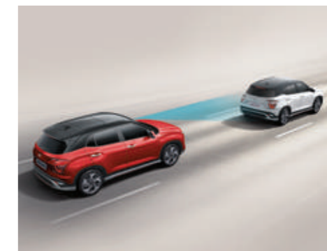
Hỗ trợ phòng tránh và chạm phía trước FCA (Bản Cao Cấp)