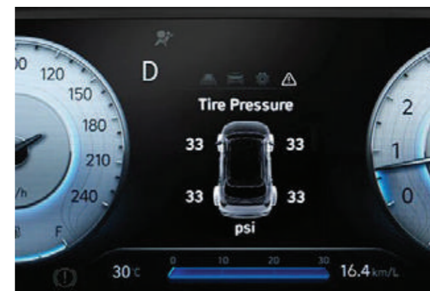
Hệ thống cảm biến áp suất lốp