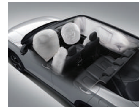
Hệ thống 6 túi khí (Bản Đặc biệt/Cao cấp)