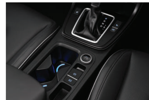
Phanh tay điện tử