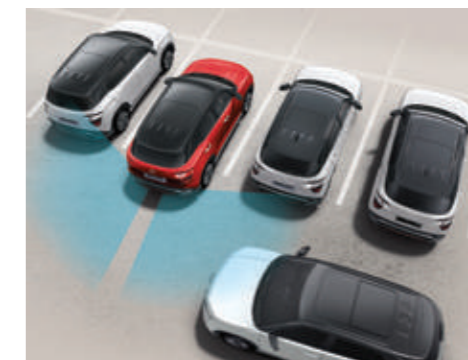
Hỗ trợ phòng tránh và chạm phía sau RCCA (Bản Cao Cấp)