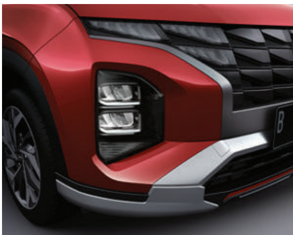
Đèn chiếu sáng LED (Phiên bản Đặc biệt/Cao cấp)