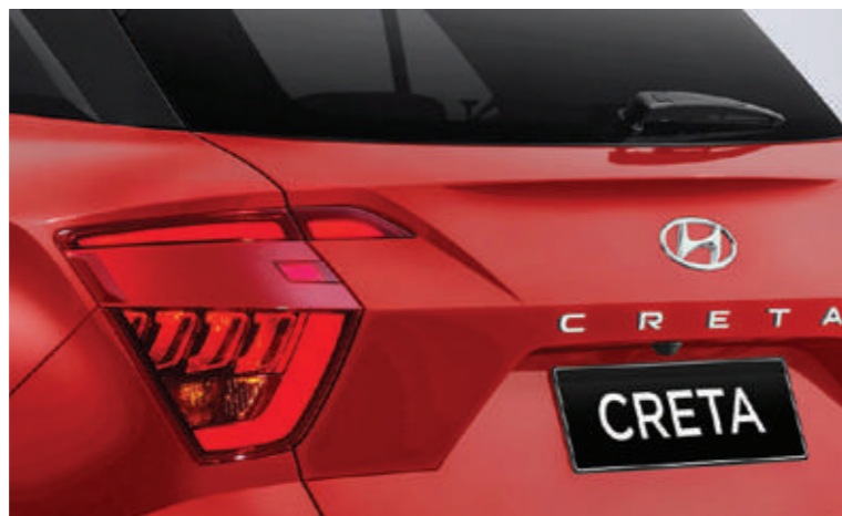
Cụm đèn hậu dạng LED (Phiên bản Đặc biệt/Cao cấp)