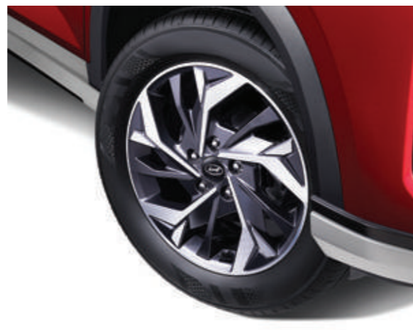
Vành hợp kim 17 inch 2 tone màu (Phiên bản Đặc biệt/Cao cấp)