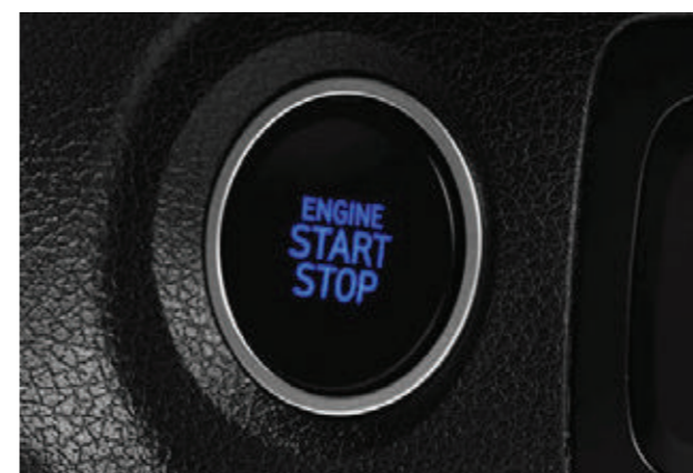
Khởi động bằng nút bấm