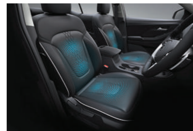
Làm mát hàng ghế trước (Bản Cao cấp)