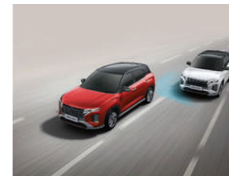
Hỗ trợ phòng tránh điểm mù BCA (Bản Cao Cấp)

Động cơ xăng SmartStream G1.5 sản sinh công suất cực đại 115 mã lực tại 6300 vòng/phút và đạt momen xoắn cực đại 144Nm tại 4500 vòng/phút