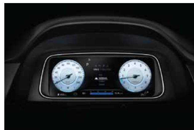
Màn hình thông tin digital 10.25 inch (Bản Cao cấp)