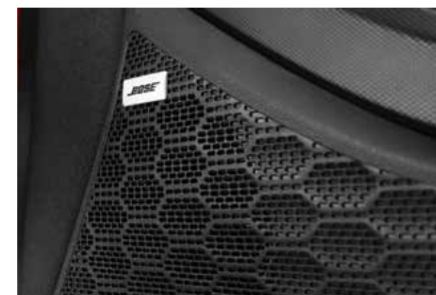
Hệ thống loa Bose cao cấp (Bản Đặc Biệt và Cao cấp)