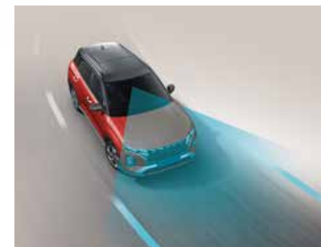
Hỗ trợ giữ làn đường LFA (Bản Cao Cấp)