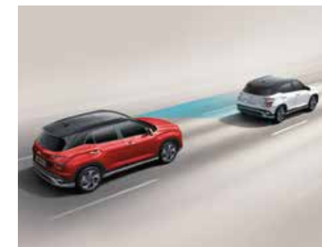
Hỗ trợ phòng tránh va chạm phía trước FCA (Bản Cao Cấp)