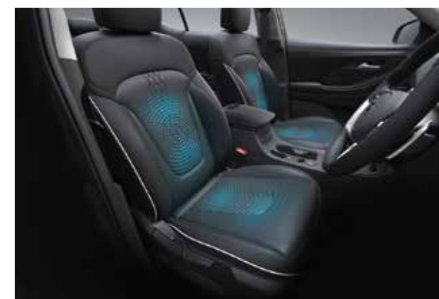
Làm mát hàng ghế trước (Bản Cao cấp)