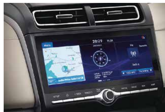
Màn hình giải trí 10.25 inch

CRETA mang đến sự thoải mái tối đa bằng không gian rộng rãi cùng các tiện ích hàng đầu phân khúc