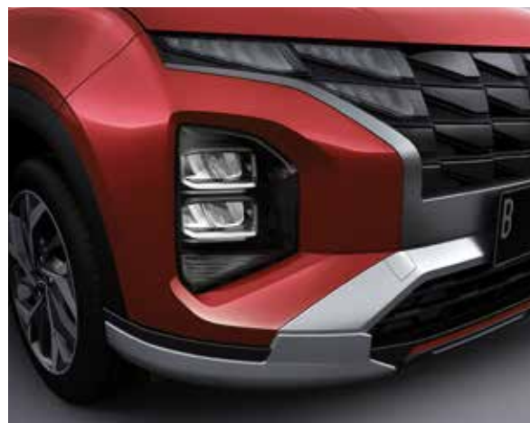
Đèn chiếu sáng LED (Phiên bản Đặc biệt/Cao cấp)