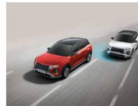
Hỗ trợ phòng tránh điểm mù BCA (Bản Cao Cấp)

Động cơ xăng SmartStream G1.5 sản sinh công suất cực đại 115 mã lực tại 6300 vòng/phút và đạt momen xoắn cực đại 144Nm tại 4500 vòng/phút