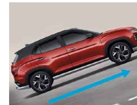
Khởi hành ngang dốc HAC