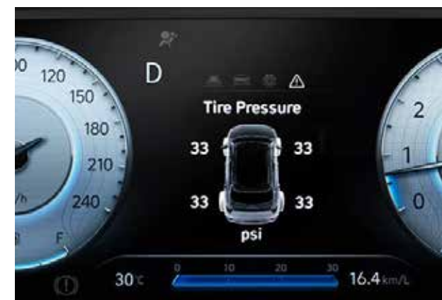
Hệ thống cảm biến áp suất lốp