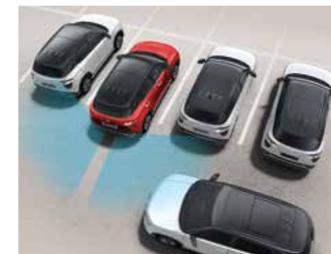
Hỗ trợ phòng tránh va chạm phía sau RCCA (Bản Cao Cấp)