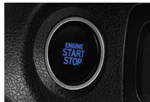
Khởi động bằng nút bấm