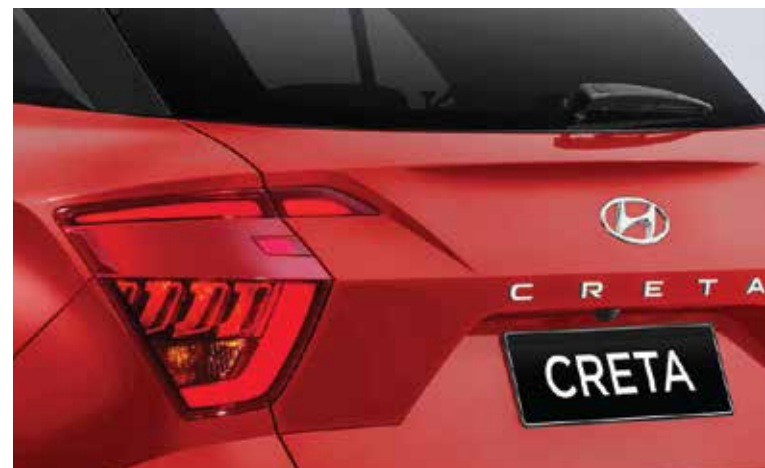
Cụm đèn hậu dạng LED (Phiên bản Đặc biệt/Cao cấp)