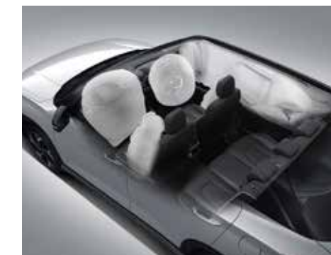
Hệ thống 6 túi khí (Bản Đặc biệt/Cao cấp)