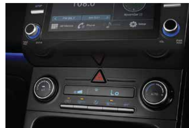
Điều hòa tự động (Bản Đặc Biệt và Cao cấp)