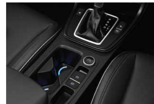
Phanh tay điện tử