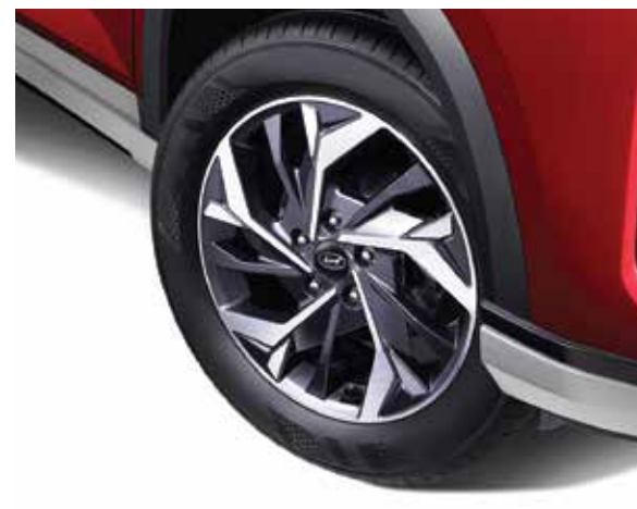
Vành hợp kim 17 inch 2 tone màu (Phiên bản Đặc biệt/Cao cấp)