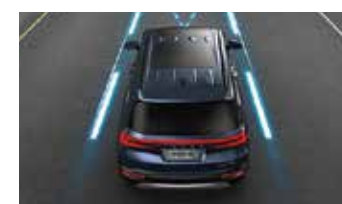
Hỗ trợ giữ làn đường