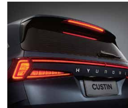
Cụm đèn hậu LED