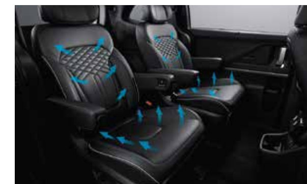
Ghế thương gia tích hợp sưởi và làm mát ghế (1.5T Đặc biệt/ 2.0T Cao cấp)