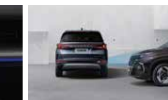
Hỗ trợ phòng tránh va chạm khi lùi xe