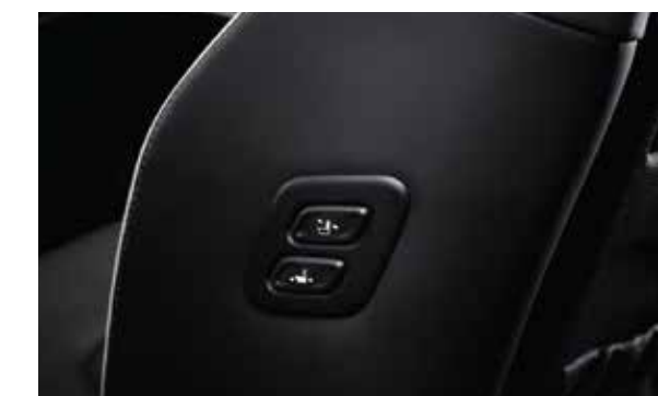
Tính năng walk-in (1.5T Đặc biệt/ 2.0T Cao cấp)