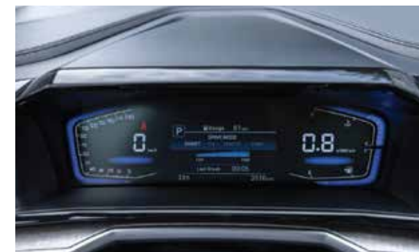
Màn hình thông tin dạng Kỹ thuật số

Thiết kế khoang nội thất lấy cảm hứng từ phi thuyền không gian, Hyundai Custin hướng đến sự thoải mái tiện nghi cho cả người lái và hành khách với phong cách sang trọng, hiện đại đi kèm một không gian rộng rãi.