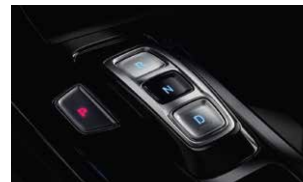
Lẫy chuyển số dạng nút bấm