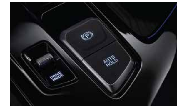
Phanh tay điện tử