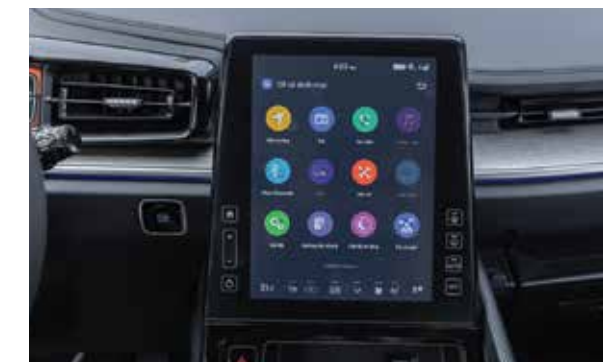
Màn hình giải trí 10.4 inch