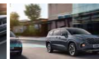
Hỗ trợ phòng tránh va chạm điểm mù