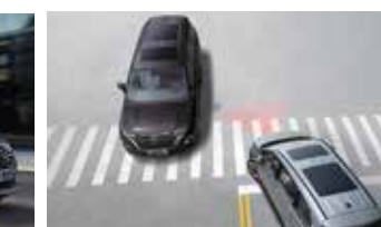
Hỗ trợ phòng tránh va chạm phía trước