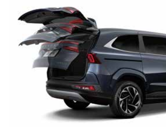
Cốp điện thông minh (1.5T Đặc biệt/ 2.0T Cao cấp)