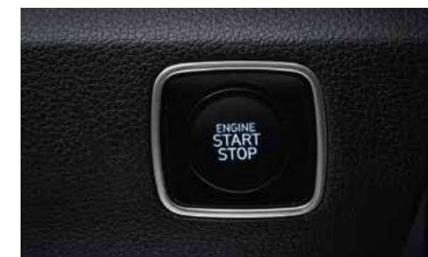
Smartkey cùng khởi động bằng nút bấm