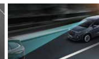
Kiểm soát hành trình thích ứng