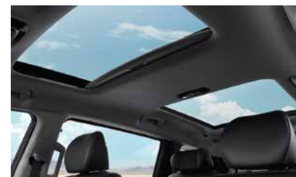
Cửa sổ trời đôi (1.5T Đặc biệt/ 2.0T Cao cấp)