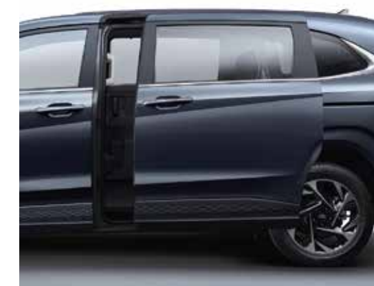
Cửa bên trượt điện