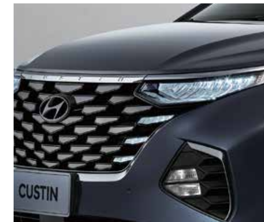
Đèn chiếu sáng LED

Cụm đèn LED thiết kế “Parametric Hidden Lights” kết hợp với các đường nét hiện đại tạo nên hình ảnh trẻ trung đẳng cấp cho Hyundai Custin.