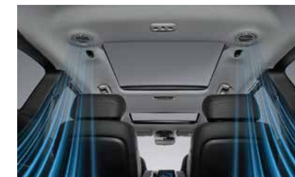
Điều hòa tự động với cửa gió cho 3 hàng ghế